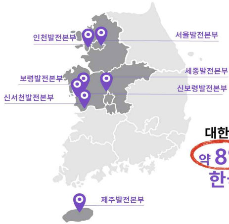
국내 발전본부 현황