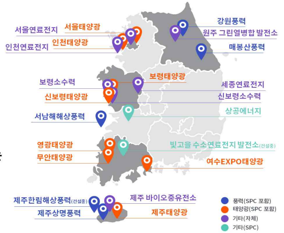
국내 주요 신재생에너지 현황